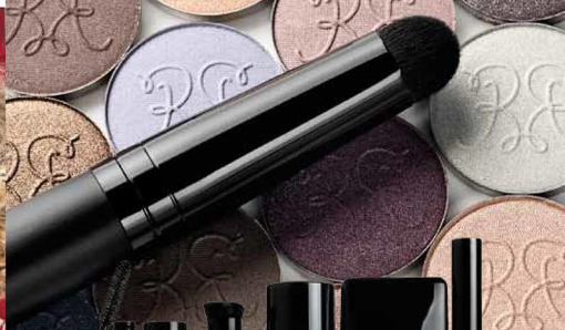
Značka Rouge Bunny Rouge seženete v Parfumerii Douglas.