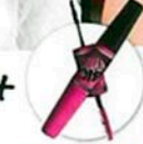
ŠIROCE OTEVŘENÉ Řasenka „Volium“ Express Big Eyes“ (Maybelline NY, 249 Kč)