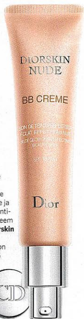
Ainulaadse kauni sära annab näole mineraalide ja antioksidantidega BB-creem Diorilt Dior Skin Nude BB Cream (toon 001). 41.95