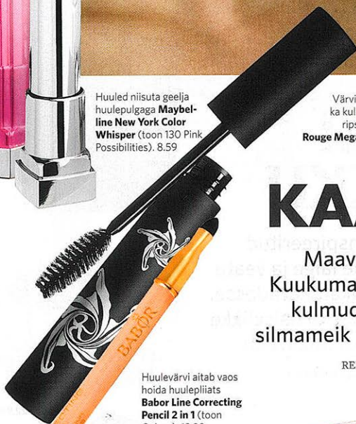
Huulevärvi aitab vaos hoida huulepliits Babor Line Correcting Pencil 2 in 1 (toon Crème). 13.99