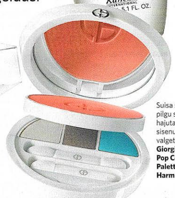
Suisa pilgu s hajuata sisenu valget Giorgio Armani Parlett