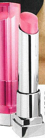
Huuled niisuta geelja huulepulgaga Maybel-line New York Color Whisper (toon 130 Pink Possibilities). 8.59