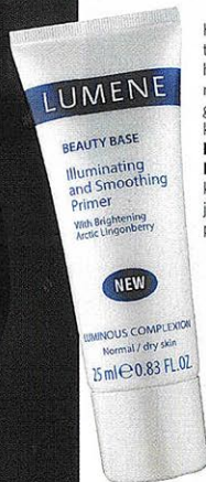
Korreedisähvastustena trendikad helendused lisa näole valgustpeeldava meigialuskreemiga Lumene Beauty Base Illuminating Primer , kasutades seda jumestuskreemi peal. 9.20