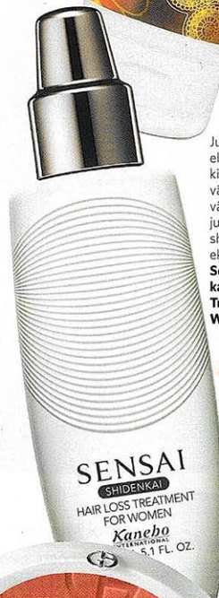
Juust elujõu kihara väge väljaljuuks shima ekstraktiga Sensai Hair Loss Treatment for Women.