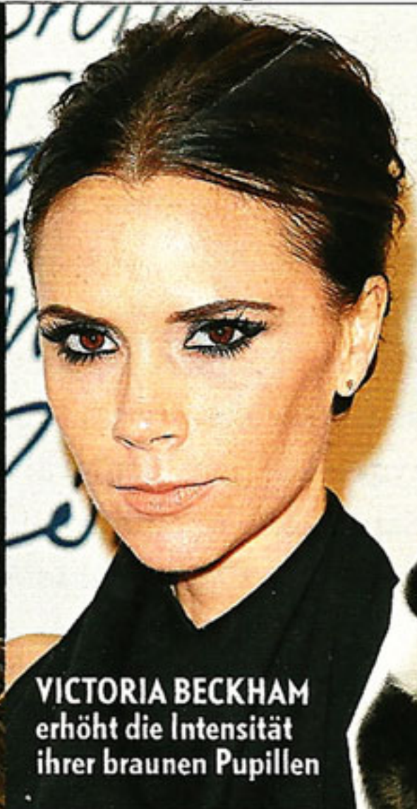
VICTORIA BECKHAM erhöht die Intensität ihrer braunen Pupillen