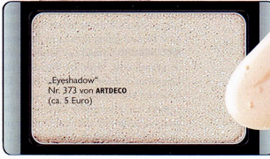
„Eyeshadow“ Nr. 373 von ARTDECO (ca. 5 Euro)