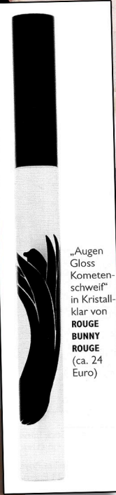
„Augen Gloss Kometenschweif“ in Kristallklar von ROUGE BUNNY ROUGE (ca. 24 Euro)