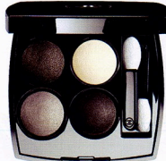
„Les 4 Ombres“ in Mystère von CHANEL (ca. 48 Euro)