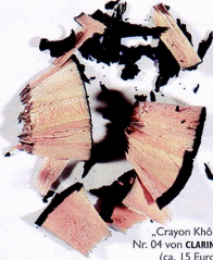
„Crayon Kohl“ Nr. 04 von CLAYTON (ca. 15 Euro)