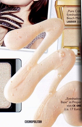
„Eyeshadow Base“ in PROPER von CK ONE (ca. 17 Euro)