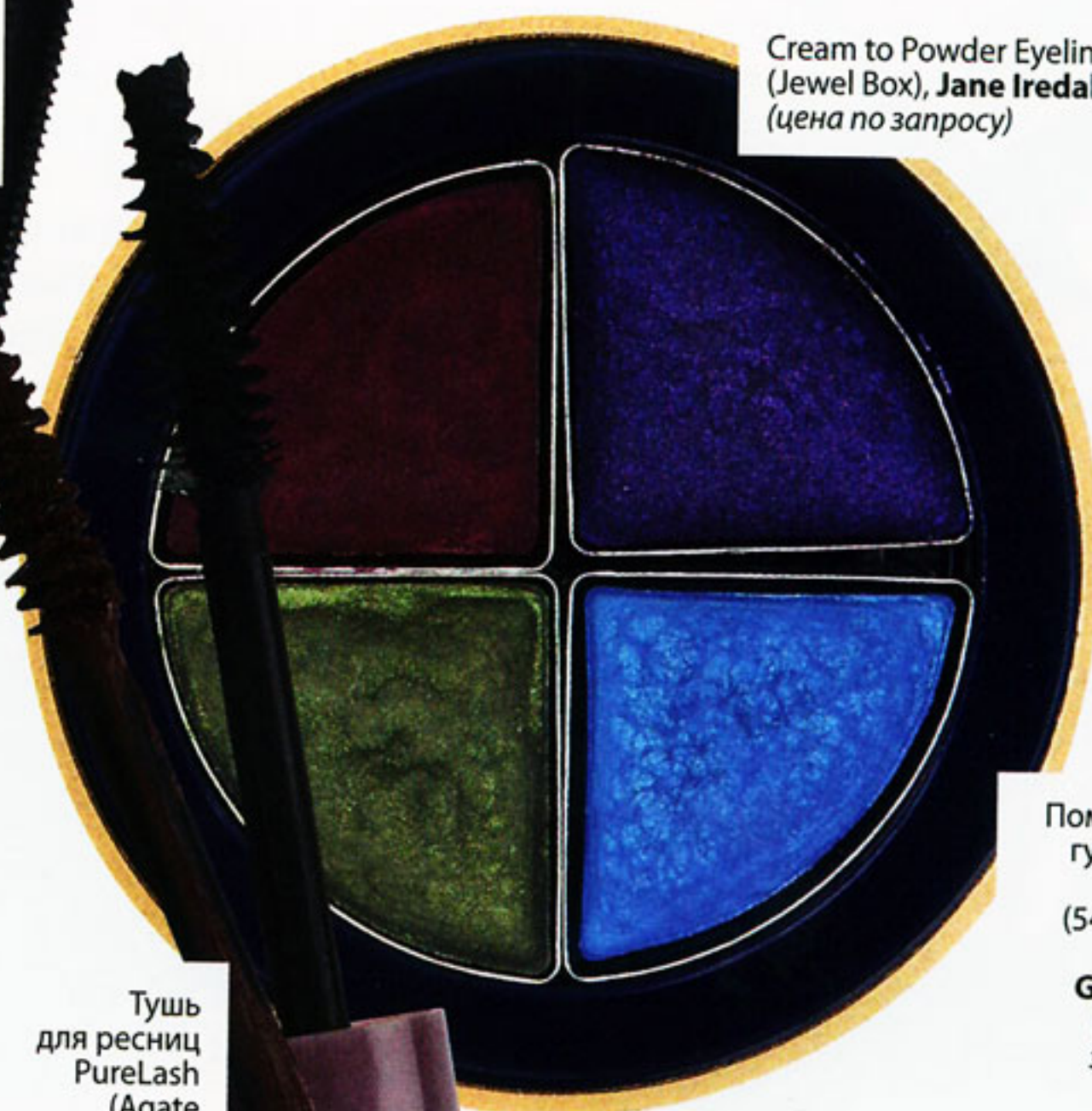
Cream to Powder Eyeliner (Jewel Box), Jane Iredale (цена по запросу)