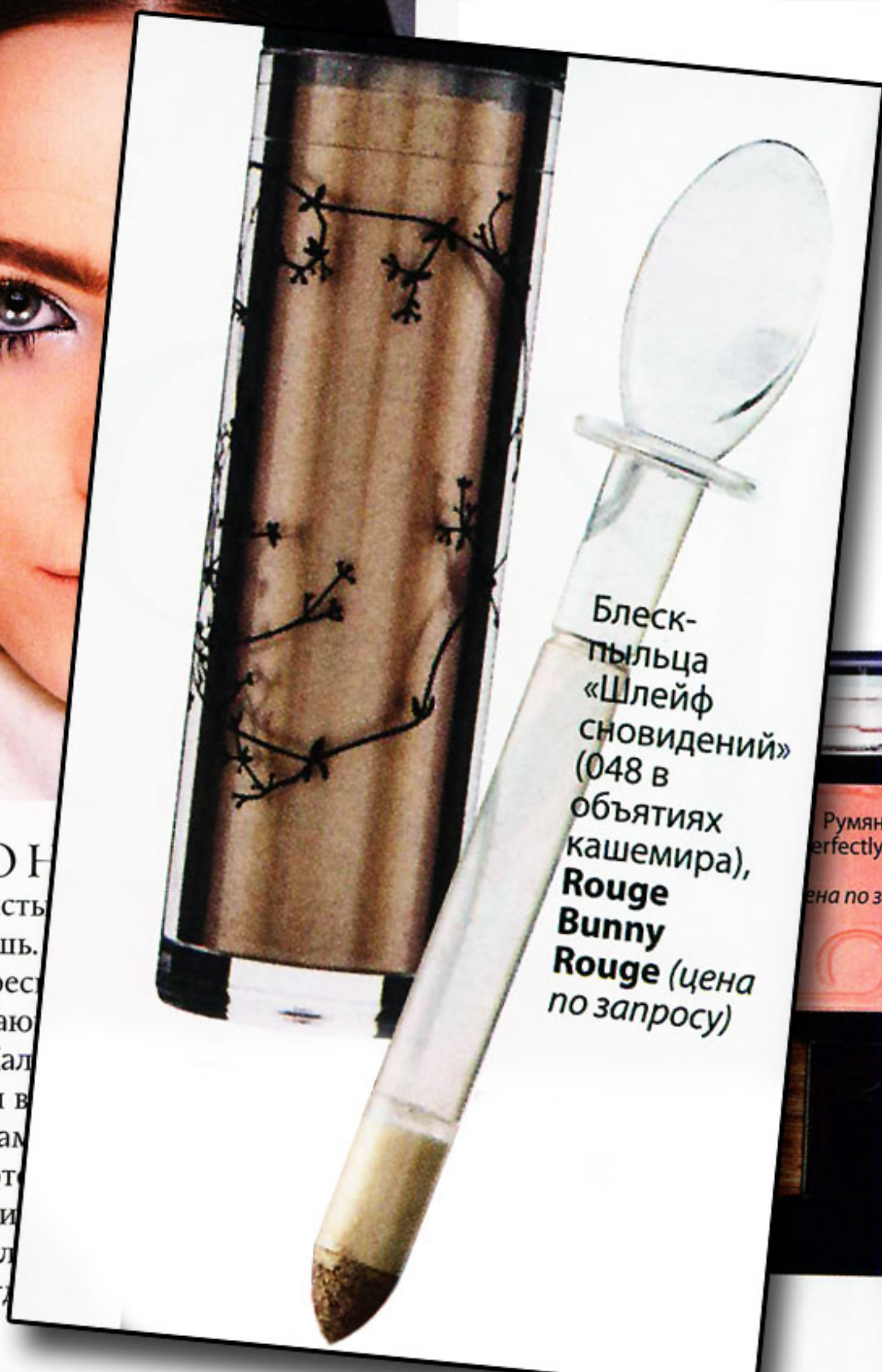
Блеск-пыльца «Шлейф сновидений» (048 в объятиях кашемира), Rouge Bunny Rouge (цена по запросу)

МНОГО Н Так визажисты рят про тушь. разделять рес ной окружаю комочки. Как пригодится в с айлайнером для глаз, кот вать стрелки цам они дол и как никогд