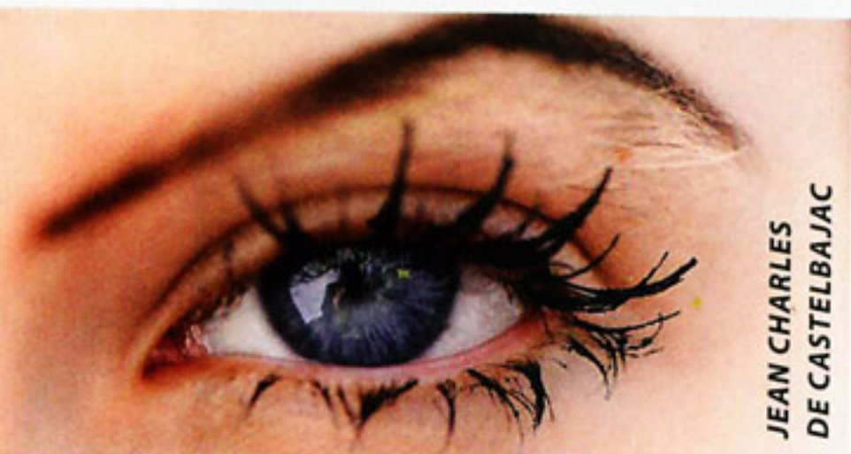
JEAN CHARLES DE CASTELBAJAC

Матовая или текстурная сияющая кожа, спокойные или вызывающие губы, но едва ли не всегда подчеркнутые глаза. Рисуем стрелки и не скупимся на тушь