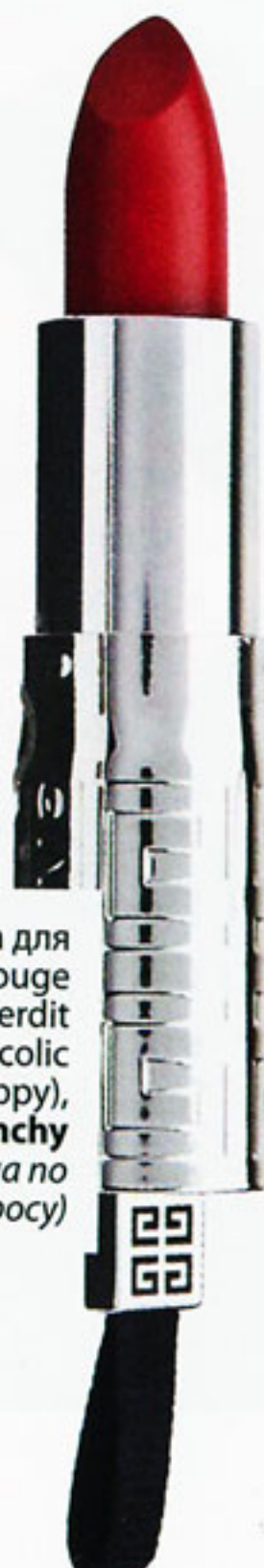
Помада для губ Rouge Interdit (54 Bucolic Poppy), Givenchy (цена по запросу)