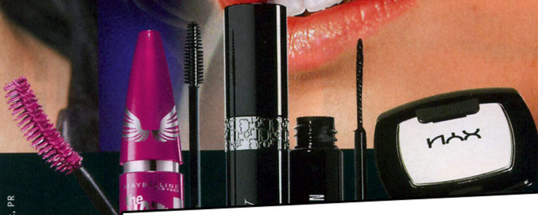
Слево направо: 1. Тушь с эффектом накладных ресниц Maybelline