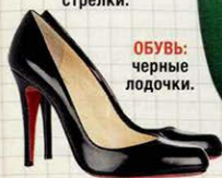
ОБУВЬ: черные лодочки.