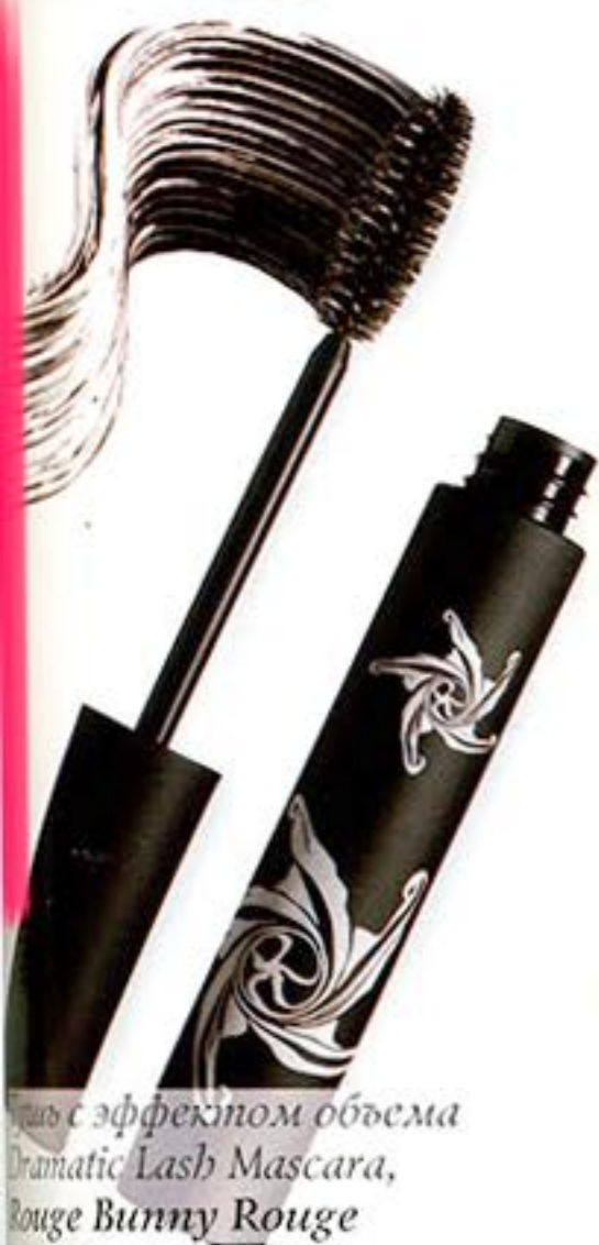
Маскара с эффектом объема Dramatic Lash Mascara, Rouge Bunny Rouge