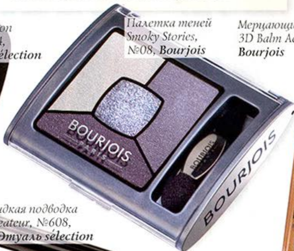
Палетка теней Smoky Stories, №08, Bourjois