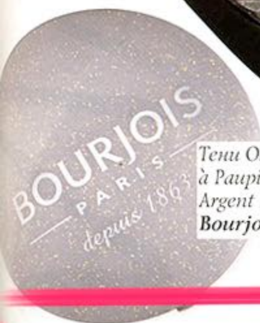
Тени Ombre à Paupières, №25 Argent Paillette, Bourjois