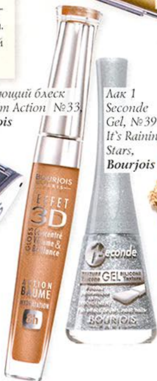
Лак 1 Seconde Gel, №39 It's Raining Stars, Bourjois