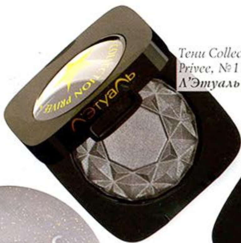
Тени Collection Privee, №115, Л'Этуаль sélection