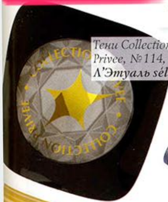
Тени Collection Privee, №114, Л'Этуаль sélection