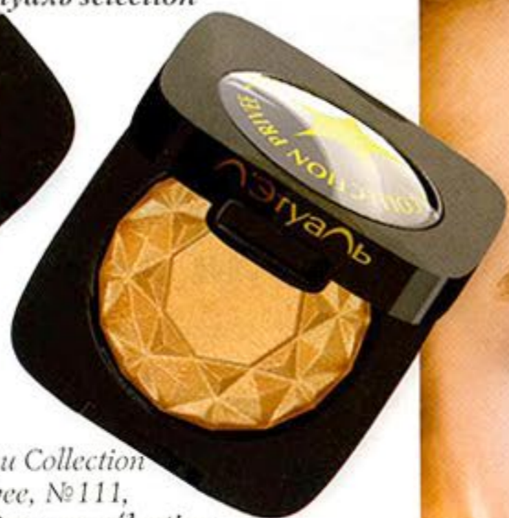
Тени Collection Privee, №111, Л'Этуаль sélection