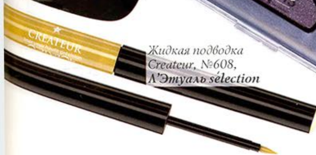
Жидкая подводка Createur, №608, Л'Этуаль sélection