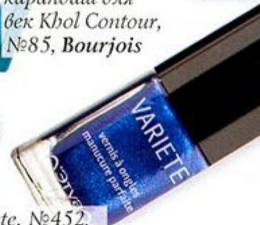
Лак Variete, №452, Л'Этуаль sélection