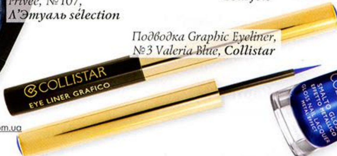
Подводка Graphic Eyeliner, №3 Valeria Blue, Collistar