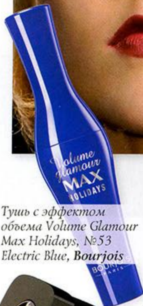
Тушь с эффектом объема Volume Glamour Max Holidays, №53 Electric Blue, Bourjois