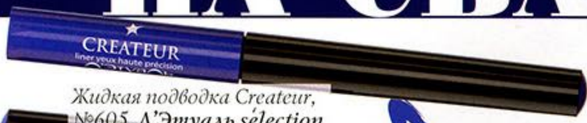
Жидкая подводка Createur, №605, Л'Этуаль sélection

ОСЕННИЕ МОДНЫЕ ТЕНДЕНЦИИ МАКИЯЖА СЛОВНО СОЗДАНЫ ДЛЯ НЕВЕСТ. СРЕДИ НИХ КАЖДАЯ ДЕВУШКА СМОЖЕТ НАЙТИ СВОЙ ИДЕАЛЬНЫЙ ОБРАЗ.