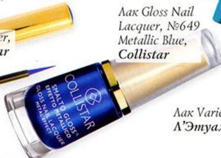
Лак Gloss Nail Lacquer, №649 Metallic Blue, Collistar