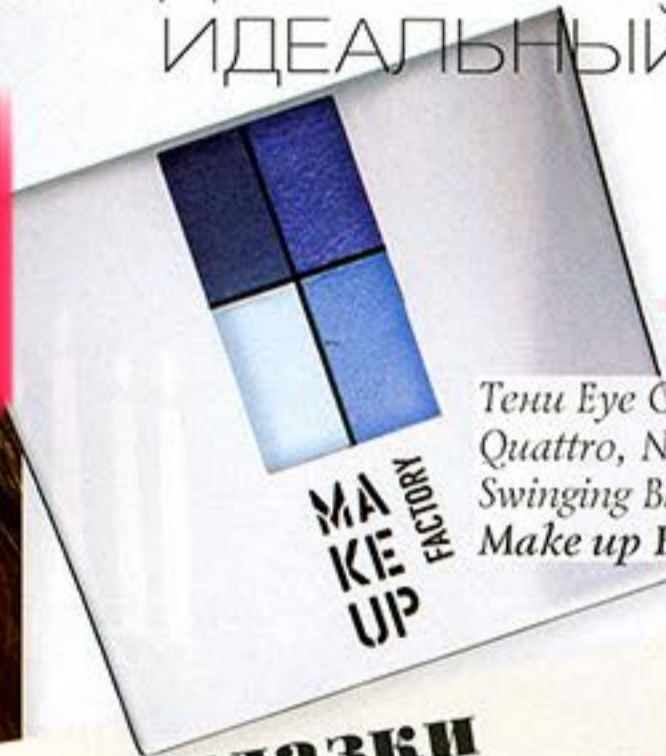
Tenu Eye Colors Quattro, №3 Swinging Blues, Make up Factory