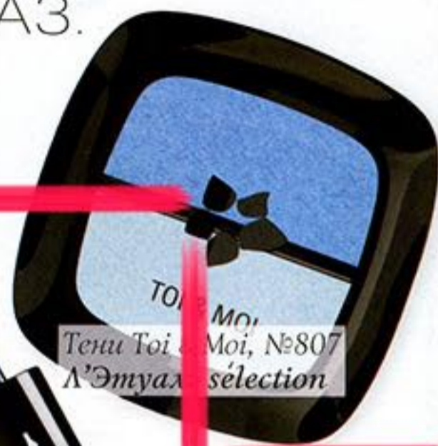
Tenu Toi Moi, №807 Л'Этуаль sélection