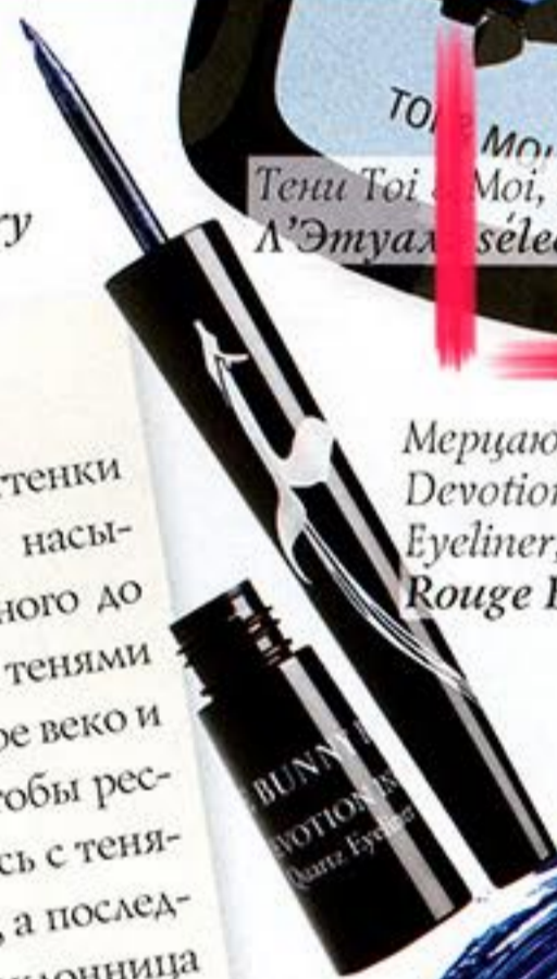
Мерцающая подводка Devotion Ink Quartz Eyeliner, Tanzanite Es Rouge Bunny Rouge

В этом сезоне в моду возвращаются все оттенки синего: от нежного пастельно-голубого до насыщенного индиго, от матового полупрозрачного до блестящего и перламутрового. Синими тенями можно покрыть монохромно все подвижное веко и дополнить такой макияж синей тушью. Чтобы ресницы были выразительными и не сливались с тенями, прокрасьте их сначала черной тушью, а последним слоем нанесите синюю. Если вы поклонница более сдержанного макияжа, можете подкрасить глаза синими стрелками — они прекрасно освежают взгляд. Если вы любите оригинальный макияж «с изюминкой», подведите голубым карандашом нижнее веко, а верхнее — покройте матовыми черными тенями. При этом нижние ресницы покрасьте голубой тушью, а верхние — черной. И универсальный вариант, который подходит практически всем, — подчеркнуть синими тенями только внешние уголки глаз. Маленькая деталь: все оттенки синего идеально смотрятся именно с белоснежными платьями. Отличное дополнение для такого макияжа — это бежевая помада и маникюр в цвет глаз.