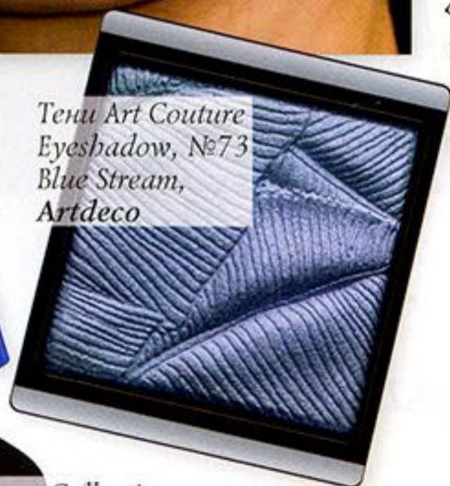
Tenu Art Couture Eyeshadow, №73 Blue Stream, Artdeco