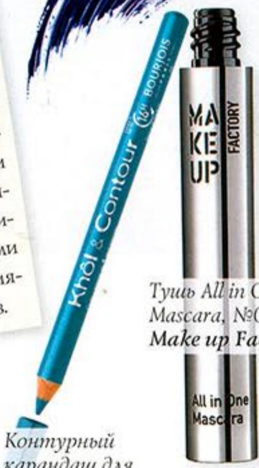
Контурирующий карандаш для век Khol Contour, №85, Bourjois