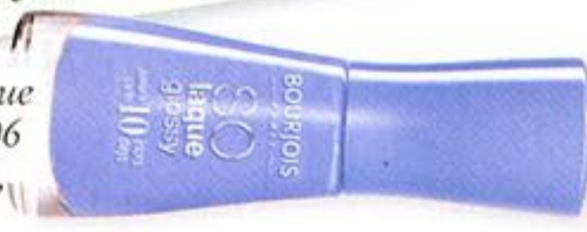
Лак So Laque Glossy, №06 Adora Bleu, Bourjois