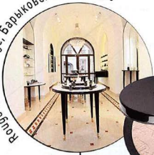
Роже Винну Роже, Барыковский пер., д. 6