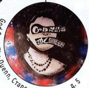
God Save The Queen, Старопанский пер., д. 5